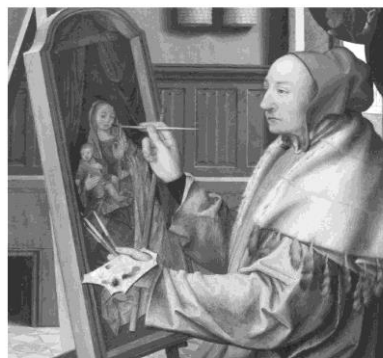
Quentin Massys, Der heilige Lukas malt die Jungfrau mit dem Kind , um 1520

Die Marienfeste im September: Mariä Geburt (8.), Mariä Namen (12.) und Mariä Schmerzen (15.) betrachten unterschiedliche Phasen im Leben der Gottesmutter. Mit diesen erst im Mittelalter oder in der frühen Neuzeit eingeführten Festen zeichnet die Kirche ein Bild Mariens und steht damit in einer sehr alten Tradition. Nach der Überlieferung früher Kirchenschreiber soll der Evangelist Lukas als Erster ein Abbild der Gottesmutter mit dem Jesuskind gemalt haben.