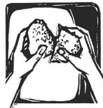
Du brichst das Brot mit uns.

anschl. Ölbergandacht (bis 21.00 Uhr) - Gestaltung: Kolpingfamilie