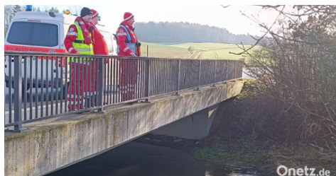
Mitterteich | 1 Min.

65-Jähriger bei Vermissten-suche in Mitterteich tot aufgefunden