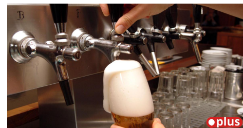
Pfreimd | 2 Min.

Geisterfahrer fährt 25 Kilometer auf A 3 in falsche Richtung